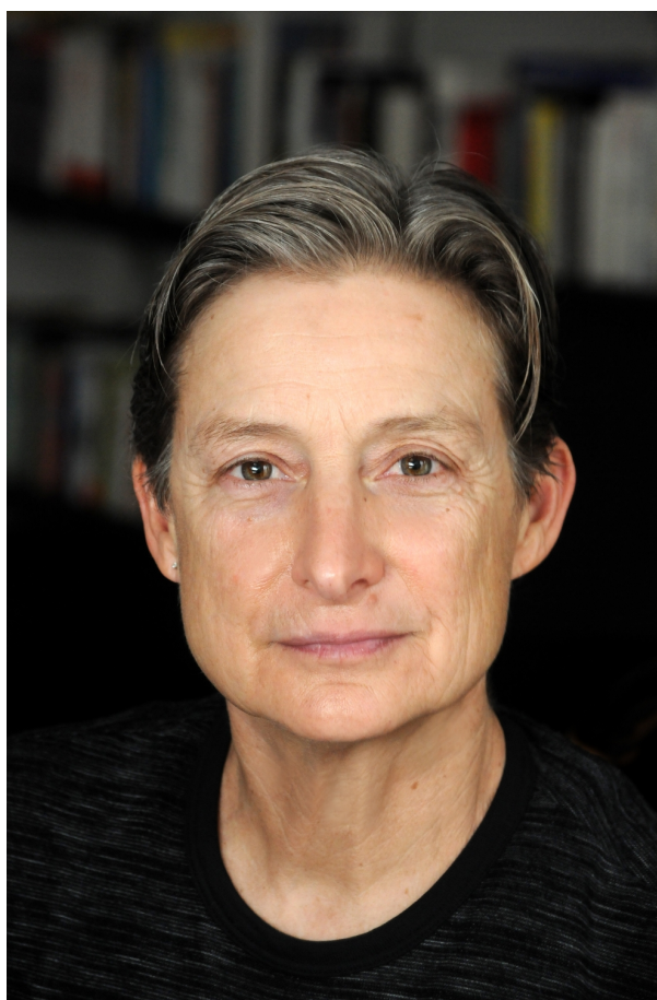
Judith Butler (1956-)

Det er næppe muligt at overvurdere betydningen af Butlers bog. Den har formet tankegangen hos en meget stor del af vores tids undervisere på de humanistiske uddannelser, især inden for sociologi, kønsforskning og pædagogik. Vi skal konkret se på, hvordan de pædagogstuderende i Danmark møder og intensivt præges med Butlers tanker.