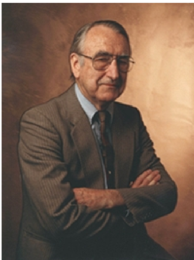
John Money (1923-2006)

Forældrene var ulykkelige over det, der var sket, men nogle måneder senere så de et tv-program, som vakte håb hos dem. I programmet fortalte en fremtrædende psykolog og sexolog, John Money, om kønsskifteoperationer. John Money var på dette tidspunkt en ledende fortaler for tanken om, at køn er kulturelt be-